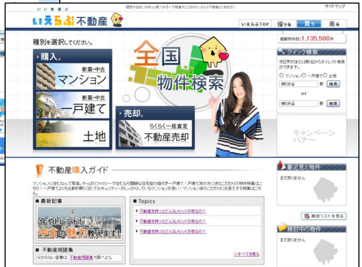
いえらぶ不動産 画面イメージ