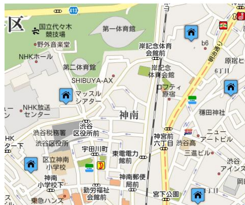
地図検索 イメージ