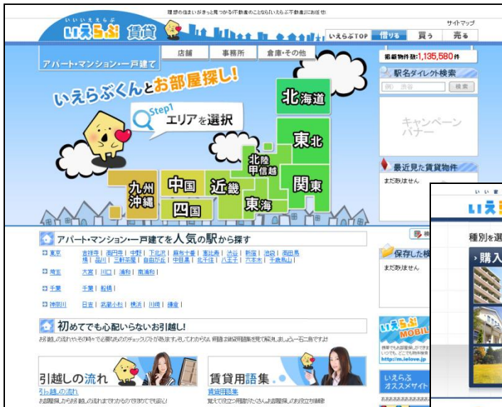
いえらぶ賃貸 画面イメージ